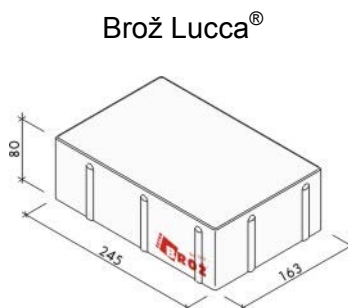
Obrázek č.1: Rozměrové parametry prvku